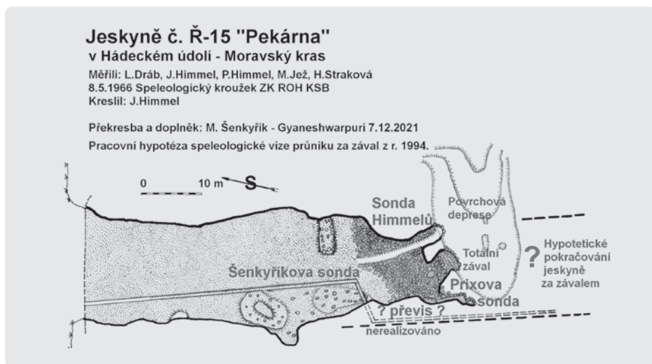
Himmelova mapa jeskyně Pekárna z r. 1966, překreslil a doplnil M. Gyaneshwarpuri, 2021