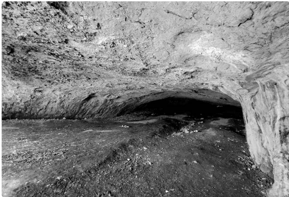
Zářez Šenkyříkovy sondy Speleohistorického klubu Brno je dosud zřetelný v sedimentech dna jeskyně Pekárna.